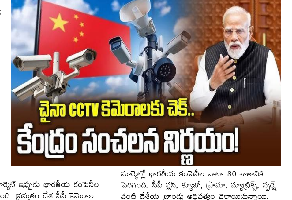
చైనా CCTV కెమెరాలకు చెక్.. కేంద్రం సంచలన నిర్ణయం!

మార్చి 31, న్యూఢిల్లీ: మేకిన్ ఇండియాకు ప్రాధాన్యమిస్తోన్న కేంద్ర ప్రభుత్వం మరో కీలక నిర్ణయం తీసుకుంది. కొత్త స్టాండరైజేషన్ టెస్టింగ్ అండ్ క్వాలిటీ సర్టిఫికేషన్ నిబంధనల కింద చైనాలో తయారైన సీసీ కెమెరాలకు ధృవీకరణ పత్రం ఇవ్వడానికి ప్రభుత్వం నిరాకరించింది. దీంతో చైనాకు చెందిన ప్రముఖ సీసీ కెమెరాల కంపెనీలు హికివిజన్, దహువాకు బిగ్ షాక్ తగిలినట్లైంది. కేంద్ర ప్రభుత్వం నిర్ణయంతో 2026, ఏప్రిల్ 1 నుంచి దేశంలో హికివిజన్, దహువా కంపెనీల ఇంటర్నల్-కనెక్టెడ్ సీసీ కెమెరాల విక్రయాలుపై నిషేధం అమల్లోకి రానుంది. దేశంలో ఎవరైనా ఈ కంపెనీల సీసీ కెమెరాలను అమ్మితే చట్టరీత్యా నేరం. ప్రస్తుతం దేశంలోని సీసీ కెమెరాల మార్కెట్లో సింహభాగం చైనా కంపెనీలే. 80 శాతం వాటా చైనా కంపెనీల చేతుల్లోనే ఉంది. కేవలం 20 పర్సెంట్ మాత్రమే భారత కంపెనీల వాటా. అమృతకాలలో దాదాపు మూడింట ఒక వంతు వాటా చైనాదే. ఈ నేపథ్యంలో కేంద్ర ప్రభుత్వ తాజా