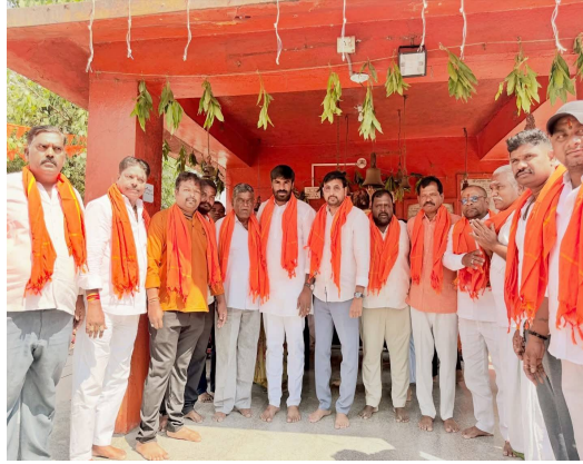
భక్తులు పెద్ద సంఖ్యలో పాల్గొని భక్తిశ్రద్ధలతో యాత్రను విజయవంతం చేశారు.