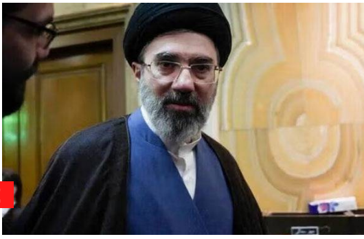
తెలుగుజ్యోతి, డెన్వో అమెరికా- జాయినిస్ట్ (అమెరికా, ఇజ్రాయెల్) శక్తులు ఎలాంటి రెచ్చగొట్టే చర్యలు లేకుండానే దాడులు చేసి విధ్వంసం సృష్టించాయని, ఈ దాడిలో ధ్వంసమైన మౌలిక

విధ్వంసం తర్వాత పునర్నిర్మాణానికి ఇరాన్ సుప్రీం లీడర్ మొజ్తబా ఖమేనీ పిలుపు అమెరికా-జాయినిస్ట్ దాడులతో ధ్వంసమైన దేశాన్ని పునర్నిర్మించాలని ఇరాన్ సుప్రీం లీడర్ పిలుపు మినాబ్‌లో బాలికల పాఠశాలపై దాడిలో 186 మంది మరణించారని వెల్లడి ప్రాణాలు కోల్పోయిన వారికి నివాళిగా దేశవ్యాప్తంగా మొక్కలు నాటాలని ప్రజలకు సూచన 2 శత్రువులు పర్యావరణాన్ని కూడా లక్ష్యంగా చేసుకుని దాడులు చేశారని ఆరోపణ ఇస్లామిక్ రిపబ్లిక్ దేశం ద్వారా దేశ ప్రజలకు మొజ్తబా ఖమేనీ సందేశం