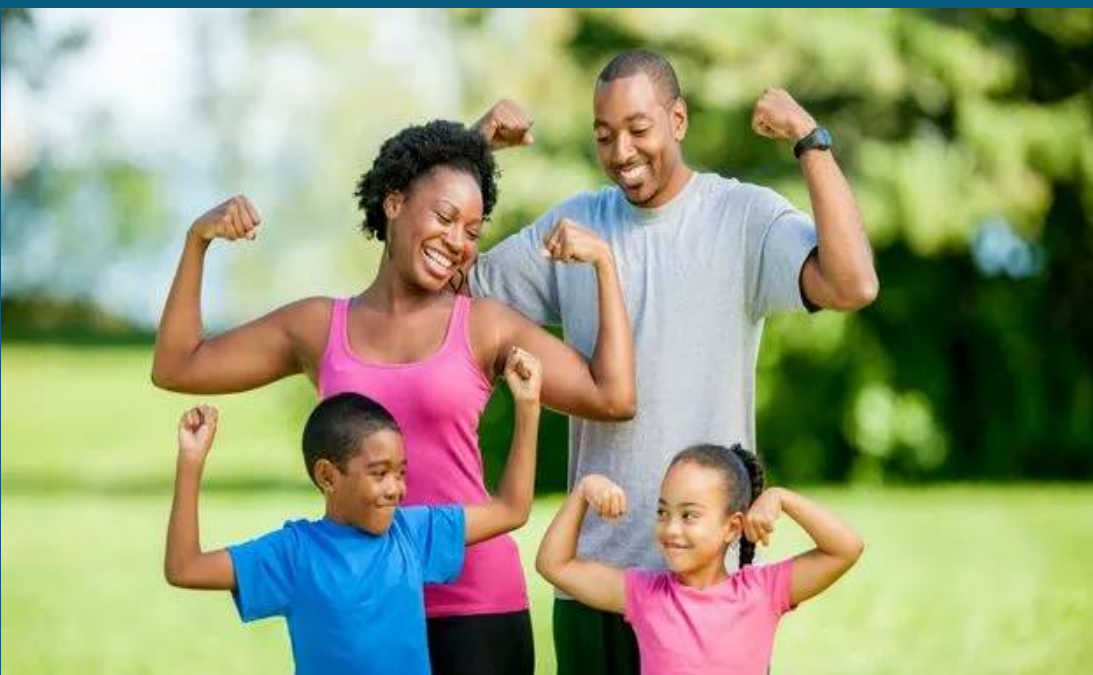
మధ్యాహ్నం 12 గంటల నుండి సాయంత్రం 4 గంటల వరకు తీవ్రమైన ఎండలో బయటకు వెళ్లకపోవడం మంచిది. ఒకవేళ బయటకు వెళ్లాలి వస్తే, వెళ్లటప్పుడు తలను టోపి, స్వార్చ్ లేదా దుపట్టాతో కవర్ చేసుకోవాలి. రోజంతా సరిపడా నీరు తాగి శరీరాన్ని హైడ్రేట్ చేయాలి. ఈ చిన్న జాగ్రత్తలు పాటిస్తే, మారుతున్న వాతావరణంలో కూడా మీరు ఆరోగ్యంగా ఉండగలుగుతారు.

ఇంటర్నెట్ డెస్క్: ప్రస్తుతం చాలా ప్రాంతాల్లో వాతావరణంలో ఆకస్మిక మార్పులు కనిపిస్తున్నాయి. పగటిపూట ఎక్కువ వేడి, సాయంత్రం చల్లదనం, మధ్యలో చల్లగా పడటం వంటి మార్పులు ఆరోగ్యంపై ప్రభావం చూపుతాయి. అందుకే ఈ సమయంలో ఆరోగ్యాన్ని కాపాడుకోవడానికి కొన్ని జాగ్రత్తలు తప్పనిసరిగా పాటించాలి. వాతావరణం మారినప్పుడు శరీర సమతుల్యత దెబ్బతింటుంది. దీని వల్ల జ్వరం, జలుబు, దగ్గు, అలర్జిక్, జీర్ణ సమస్యలు రావచ్చు. వైరల్ ఇన్ఫెక్షన్లు వచ్చే అవకాశము పెరుగుతుంది. అందుకే సరైన ఆహారం, జీవనశైలి చాలా ముఖ్యం. ఎలాంటి ఆహారం తీసుకోవాలి? ఈ సమయంలో తేలికగా జీర్ణమయ్యే ఆహారం తీసుకోవడం మంచిది. బొప్పాయి, దానిమ్మ, నారింజ వంటి పండ్లు తినడం ఆరోగ్యానికి మంచిది. అల్లం, తులసి టీ తాగడం వల్ల రోగనిరోధక శక్తి పెరుగుతుంది. ఫాస్ఫేట్, ఎక్కువ సూనె ఉన్న పదార్థాలను తగ్గించాలి. చల్లటి నీటి బదులుగా గోరువెచ్చని లేదా సాధారణ నీరు తాగడం ఆరోగ్యానికి మేలు చేస్తుంది. తులసి, అశ్వగంధ వంటి ఔషధ మొక్కలు కూడా రోగనిరోధక శక్తిని పెంచడంలో సహాయపడతాయి. పాటించాల్సిన జాగ్రత్తలు