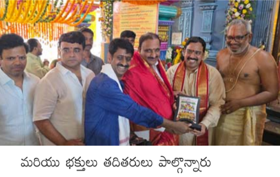
మరియు భక్తులు తదితరులు పాల్గొన్నారు