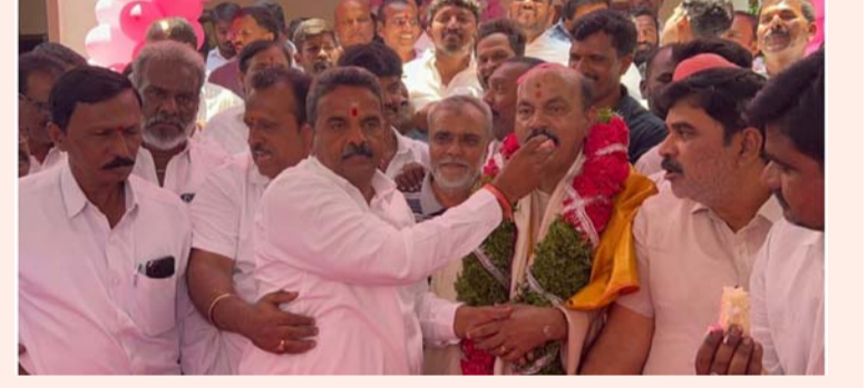
21 ఏప్రిల్ మంగళవారం తెలుగు జ్యోతి దినపత్రిక సంగారెడ్డి ప్రతినధి.