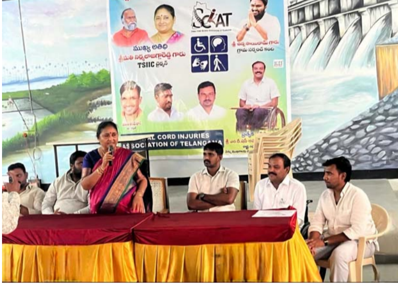
21 ఏప్రిల్ తెలుగు జ్యోతి దినపత్రిక సంగారెడ్డి.