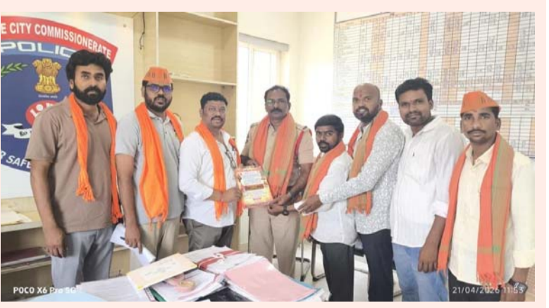
తెలుగు జ్యోతి న్యూస్ షాద్ నగర్ ప్రతినధి ఏప్రిల్ 21