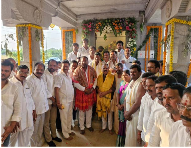
తెలుగు జ్యోతి న్యూస్ షాద్ నగర్ ప్రతీది మే 13