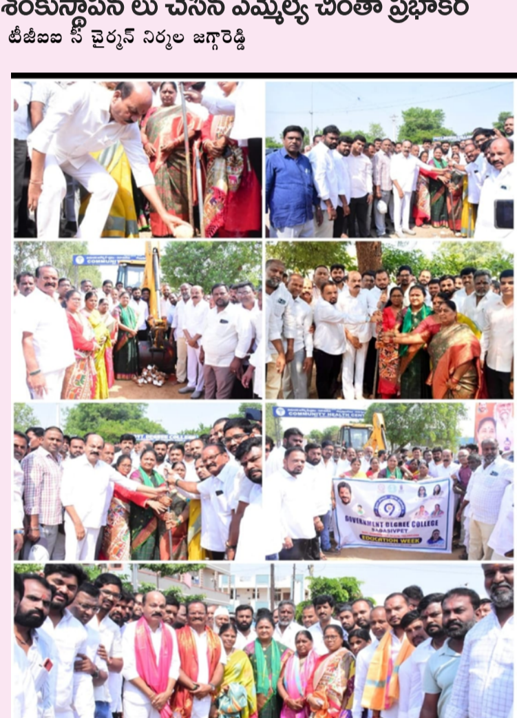
తెలుగు జ్యోతి న్యూస్ 13 మే సంగారెడ్డి ప్రతీది.