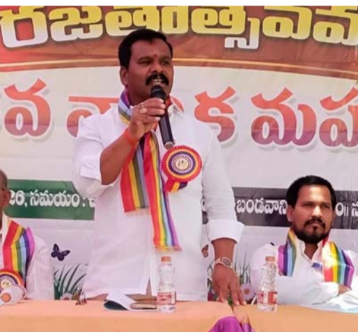
సంఘం సేవలను గుర్తుచేసుకుంటూ సభ్యులను సన్మానించారు.