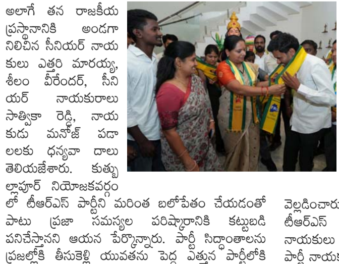
టీనుకూరువారికి కృషి చేసానని వెల్లడించారు. చేరిన కుత్బుల్లాపూర్ నియోజకవర్గంలో టీఆర్ఎస్ పార్టీకి మరింత బలం చేకూరుతుందని నాయకులు అభిప్రాయపడ్డారు. కార్యక్రమంలో పలువురు పార్టీ నాయకులు, కార్యకర్తలు, అభిమానులు పాల్గొన్నారు.