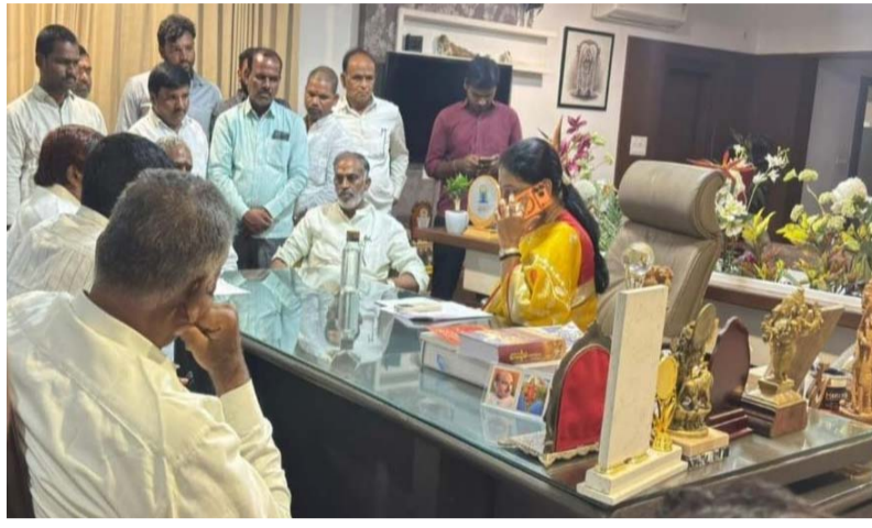
ప్రజలు ఇబ్బంది పడితే ఊరుకోను... సీఎం దృష్టికి తీసుకెళ్తా

తెలుగు జ్యోతి న్యూస్ షాద్ నగర్ ప్రతినిధి జూన్ 2 కొత్తూరు మండల పరిధిలోని సిద్ధాపూర్ గ్రామంలో ప్రతిపాదిత డంపింగ్ యార్డ్ ఏర్పాటుపై కొనసాగుతున్న ప్రజా వ్యతిరేకతకు మద్దతుగా ఎంపీ డీకే అరుణమ్మ స్పందించారు. డంపింగ్ యార్డ్ వల్ల స్థానిక ప్రజలు ఎదుర్కొనే పర్యావరణ, ఆరోగ్య సమస్యలను జేపీసీ నాయకులు ఆమె దృష్టికి తీసుకెళ్తూ, ప్రజలకు అన్యాయం జరగనివ్వబోవని హామీ ఇచ్చారు. మంగళవారం