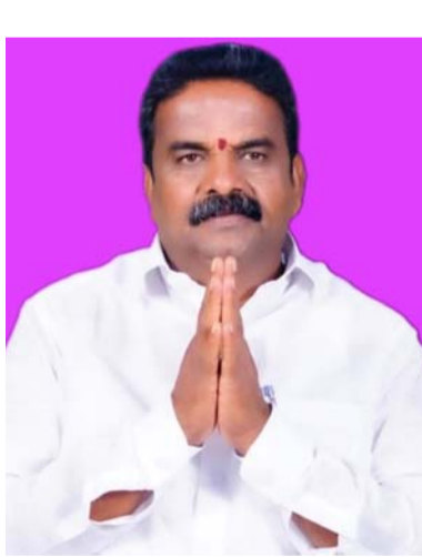
మాణిక్యం ఫౌండేషన్ సభ్యులు ఒక ప్రకటన తెలియజేశారు.